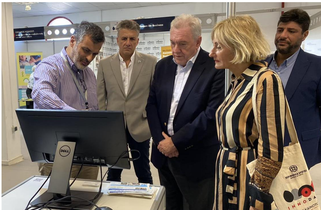
Συζήτηση του Γενικού Γραμματέα Έρευνας και Καινοτομίας Καθ. Α. Κυριαζή με τον Δρ. Ηλία Δημητρίου και τον Διευθυντή του ΙΘΑΒΒΥΚ – ΕΛΚΕΘΕ Δρ. Κ. Μυλωνά στο περίπτερο του τεχνοβλαστού “OpenELIoT”