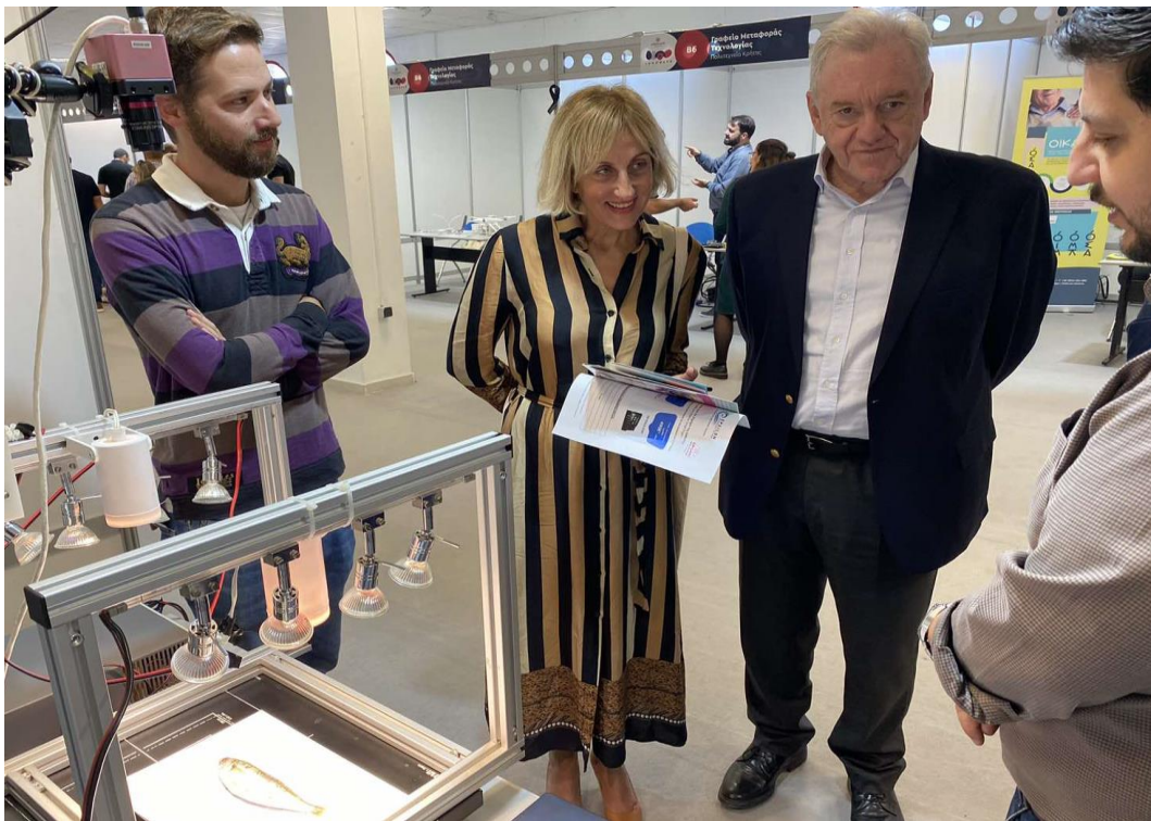
Επίσκεψη του Γενικού Γραμματέα Έρευνας και Καινοτομίας Καθ. Α. Κυριαζή στο περίπτερο του τεχνολογικού "FRESQO" και επίδειξη εκτίμησης φρεσκότητας αλιεύματος